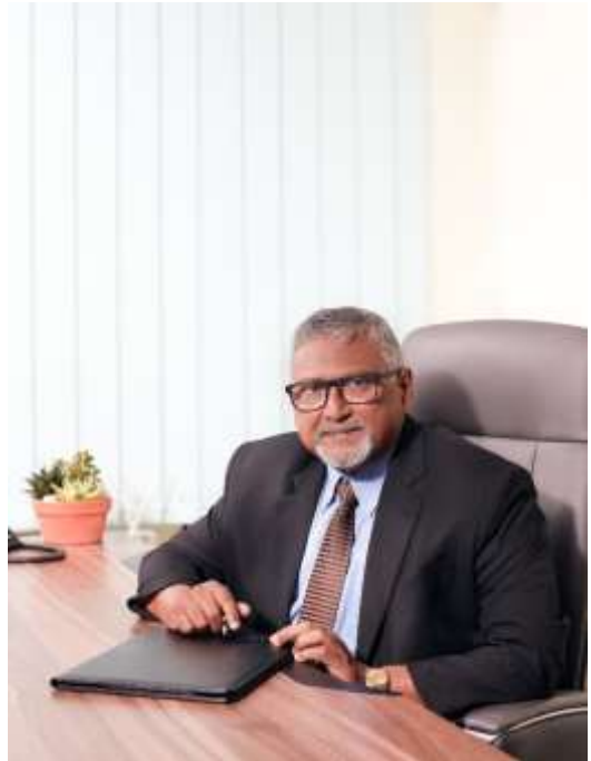
اس کے لیے نئی چیزیں کھولیں۔

لاہور-19 کے لیے ان کے لیے نئی چیزیں کھولیں۔ ان کے لیے نئی چیزیں کھولیں۔ ان کے لیے نئی چیزیں کھولیں۔ ان کے لیے نئی چیزیں کھولیں۔ ان کے لیے نئی چیزیں کھولیں۔ ان کے لیے نئی چیزیں کھولیں۔